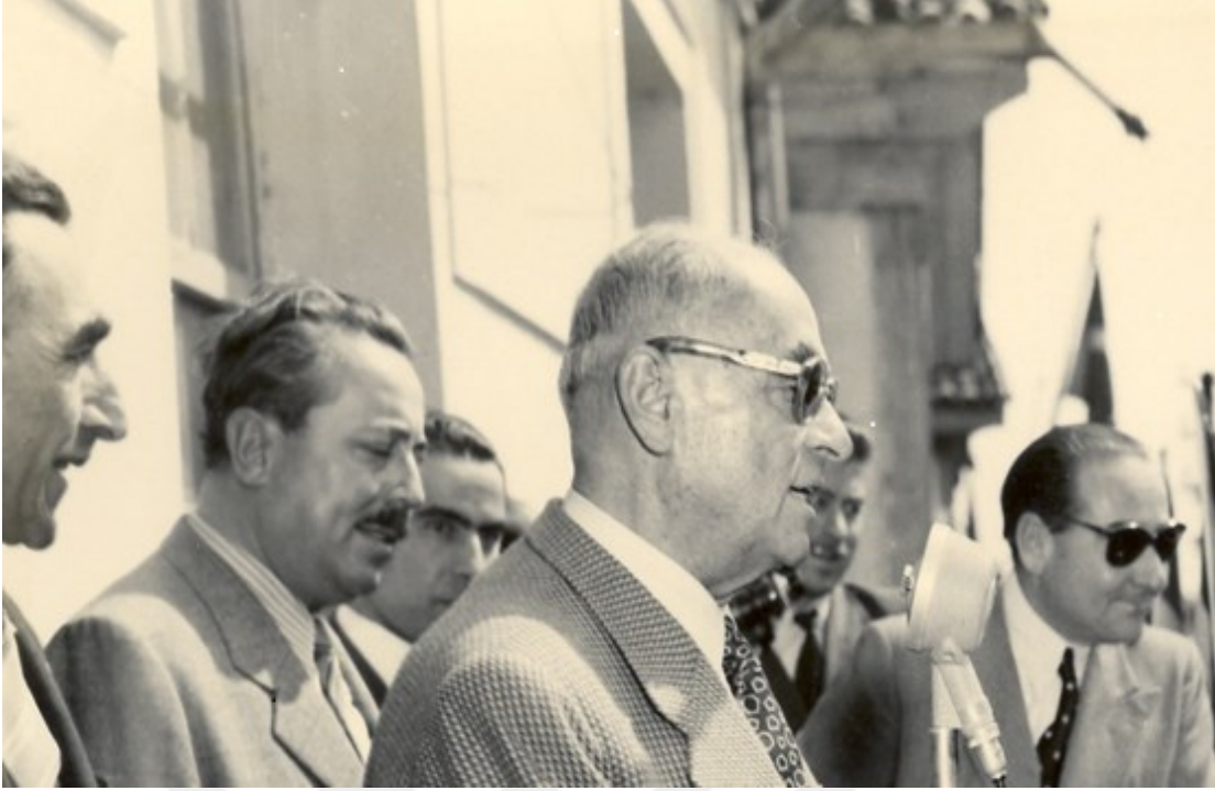
Resim 2. Amasya Şeker Fabrikası'nın açılışı sırasında Cumhurbaşkanı Celâl Bayar'ın halka yapmış olduğu hitabe.

İlhan Tarus'un Uzun Atlama eserinde yer verdiği ifadelerden anladığımız kadarıyla her şeker fabrikasının kendilerine has özellikleri bulunmaktadır. Tarus'un, Amasya Şeker Fabrikası'nı ziyaret ettiği esnada fabrikanın çevresinde dikili bulunan fidanlar dikkatini çektiği görülmüştür. Fabrika bünyesinde yer alan fidanların çokluğuna değinen Tarus kitabında şu ifadeler yer vermiştir: