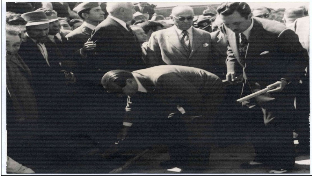
Resim 1. Amasya Şeker Fabrikası'nın temel atma töreni, Başbakan Adnan Menderes fabrika binasının temeline harç koyarken.

TŞFAŞ Genel Müdürü Baha Tekand, fabrikanın temel atma töreninde yaptığı konuşmada, Amasya'da şeker sanayi kurma fikrinin şehirde pancar tarımının büyük gelişme göstermesi sonucu oluştuğunu ifade etmiştir. Yaptığı söylevde 1934'de açılan Turhal Şeker Fabrikası'nın bölgede üretilen pancarı 1950 senesine kadar gerekli koşullar dâhilinde rahat bir şekilde işlediğini fakat son 3 yılda fabrikanın üretim konusunda sıkıntı yaşadığını, artan pancar miktarını işlemekte zorlandığını dile getirmiş ve bu sebeple Amasya'da yeni şeker fabrikasına ihtiyaç duyulduğundan bahsetmiştir. Hitabesinde Amasya'da kurulan bu fabrikanın Turhal Şeker Fabrikası'nın üretim yükünü azaltmasının yanı sıra bölgede pancar ekimine elverişli toprağı olduğu halde pancar tarımı yapayamayan çiftçi sayısında artışa neden olacağını belirtmiştir. Tekand yapmış olduğu konuşmada fabrikanın üretim kapasitesine de değinmiş, fabrikanın yirmi dört saatte yaklaşık 1.800 ile 2.000 ton, yılda ise toplam 200-250 ton pancar işleyebileceğini söylemiştir (Veldet, 1958: 847, 860).