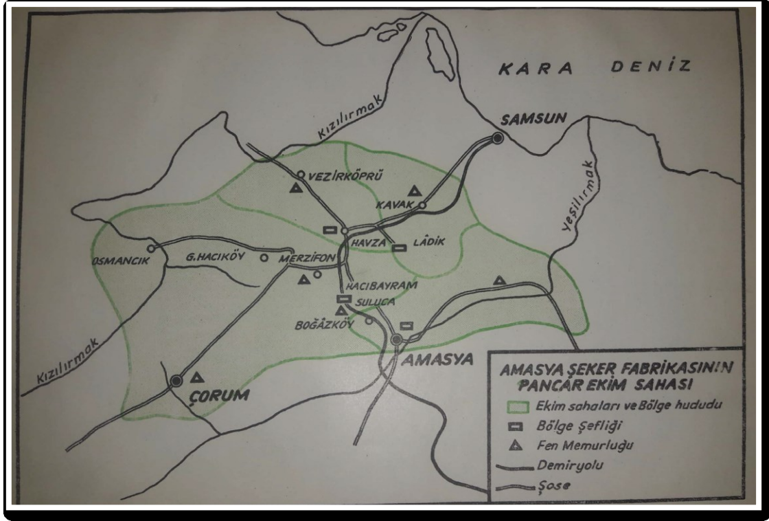
Ek 3. Amasya Şeker Fabrikası pancar ekim sahası