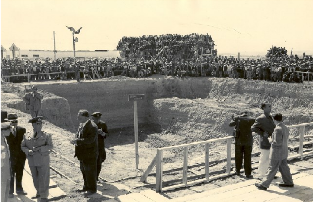
Ek 6. Amasya Şeker Fabrikası'nın temel atma törenine katılan Amasya halkı.