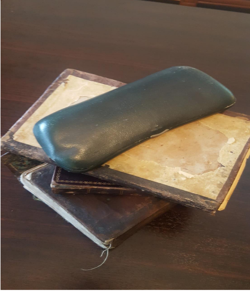
Resim 8: Ali Rıza Önder'in kişisel eşyaları.